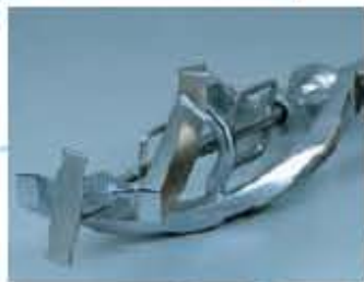
- R-Pumpe - 2E Rührwerk für hohen Volumenaufschlag