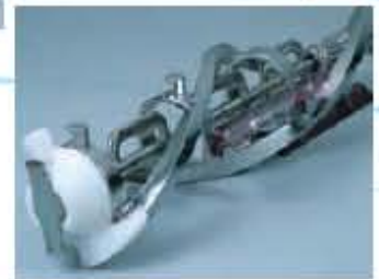
- R Pumpe - 3X-Rührwerk für hohen Volumenaufschlag